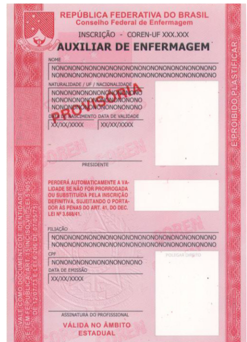
Auxiliar de Enfermagem Provisória