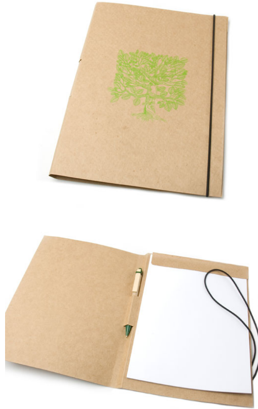
Imagens de referência

caneta devem ser personalizadas com a logo do evento e/ou a logo do Cofen. Formato fechado 19 x 26 cm. Não acompanha folhas de papel.