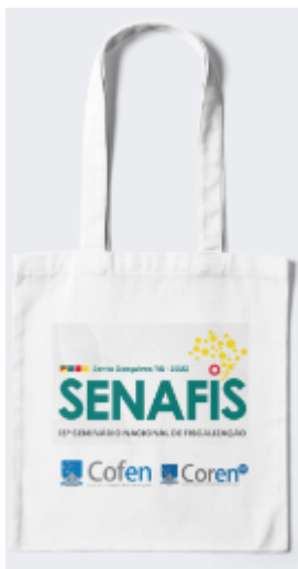
Imagens de referência

SACOLA ECOBAG: ecológica, personalizada, dimensões aproximadas de 36x42cm, algodão cru 247g, altamente resistente e de ótima qualidade, que suporte até 5kg. Impressão digital 4 cores medindo 30x30 cm com a logo do evento e de seus realizadores. 2 alças em algodão trançado medindo 3x40cm (cada)